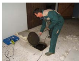
(Vérification des ouvrages d'assainissement)